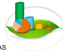
Gráfica 5-1.a. ÍNDICE DE EFECTIVIDAD DE MANEJO (IEM) DE SISTEMA NACIONAL DE LAS ÁREAS PROTEGIDAS (SINAP), SEGÚN ÁMBITO: AÑOS 2012-2013