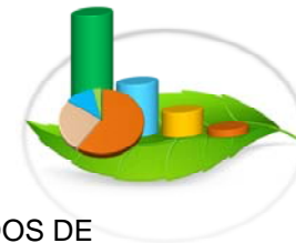
Gráfica 3-8.a. VOLUMEN DE MADERA OTORGADO, MOVILIZADO Y PERMISOS FORESTALES OTORGADOS DE EXTRACCIÓN DE MADERA, POR REGIONAL: ENERO-JUNIO 2015