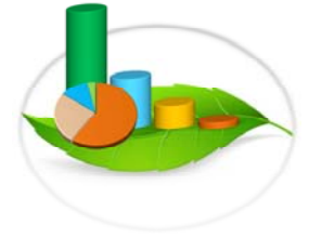
Gráfica 3-3.1.a. VOLUMEN DE AGUA OTORGADO POR ANAM EN LA REPÚBLICA DE PANAMÁ: AÑOS 2014/2015