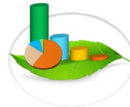
Gráfica 3-6.a. VOLUMEN DE MADERA MOVILIZADO EN LA REPÚBLICA DE PANAMÁ, POR TIPO DE PERMISO, SEGÚN REGIONAL: ENERO-JUNIO 2015