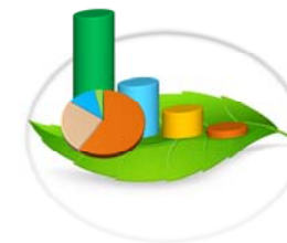
Gráfica 3-5.a. VOLUMEN DE MADERA OTORGADA PARA EL APROVECHAMIENTO FORESTAL, POR TIPO DE PERMISO, SEGÚN REGIONAL: ENERO-JUNIO 2015