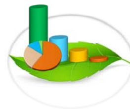
Gráfica 3-4.a. PERMISOS OTORGADOS PARA EL APROVECHAMIENTO FORESTAL, POR TIPO: ENERO-JUNIO 2015