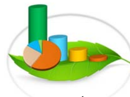
Cuadro 3-4. PERMISOS OTORGADOS PARA EL APROVECHAMIENTO FORESTAL, POR TIPO DE PERMISO, SEGÚN REGIONAL: ENERO-JUNIO 2015 (Conclusión)