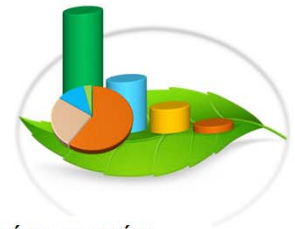
Cuadro 2-3.1. AUDITORÍAS Y PAMA'S INGRESADAS AL PROCESO DE EVALUACIÓN, SEGÚN REGIONAL: AÑO /2015