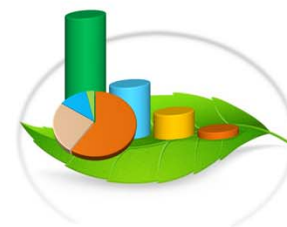
Cuadro 1-3. ZOOCRIADEROS EXISTENTES INSCRITOS, EN LA REPÚBLICA DE PANAMÁ, SEGÚN REGIONAL: AÑOS 2008 / 2015