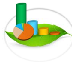
Gráfico 9-3.a. CONSUMO MENSUAL DE ENERGÍA EN MIAMBIENTE: AÑOS 2014-2015