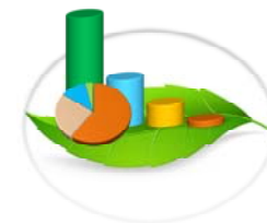
Gráfica 8-13.a. INSPECCIONES HÍDRICAS REALIZADAS, POR REGIONAL: AÑOS 2014-2015