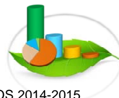
Gráfica 8-12.a. FISCALIZACIONES FORESTALES REALIZADAS, SEGÚN TIPO: AÑOS 2014-2015