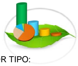
Gráfica 8-11.a. INSPECCIONES FORESTALES ESPECIALES REALIZADAS, POR TIPO: AÑOS 2014-2015