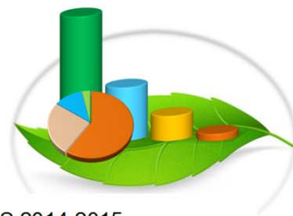
Gráfica 8-19. INSPECCIONES EN ZOCRIADEROS, SEGÚN REGIONAL: AÑOS 2014-2015