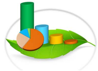
Cuadro 8-4. PLANES DE AUDITORÍAS AMBIENTALES: AÑOS 2014-2015