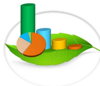
Gráfica 8-14.a. ESTUDIOS DE IMPACTO AMBIENTAL INGRESADOS Y APROBADOS POR EL PROCESO DE EVALUACIÓN: AÑOS 2014-2015