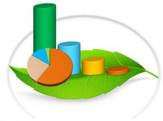
Cuadro 8-1. PAMA'S APROBADOS, SEGÚN SECTOR ECONÓMICO: AÑOS 2014- 2015