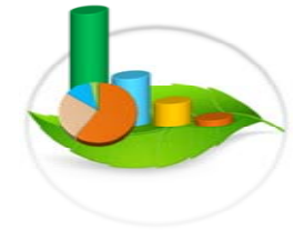
Gráfica 6-1.a. PRESUPUESTO LEY MODIFICADO DE FUNCIONAMIENTO E INVERSIÓN ASIGNADO MENSUALMENTE: AÑOS 2014-2015