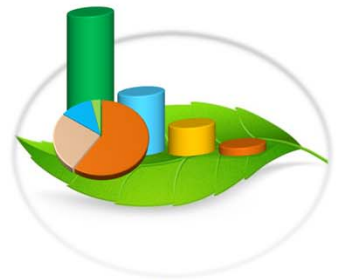
Cuadro 6-10. EXPEDIENTES POR COBRO COACTIVO, POR TIPO DE DEUDA, SEGÚN CIRCUNSCRIPCIÓN TERRITORIAL: AÑOS 2014-2015