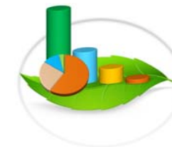
Gráfica 3-7.d. VOLUMEN DE MADERA DE ESPECIES MAYORMENTE MOVILIZADO EN LA REPÚBLICA DE PANAMÁ, POR TIPO DE PERMISO: AÑO 2015