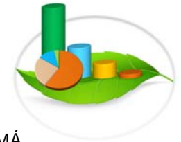
Gráfica 3-7.b. VOLUMEN DE MADERA DE ESPECIES MAYORMENTE MOVILIZADO EN LA REPÚBLICA DE PANAMÁ, POR REGIONAL DE PROCEDENCIA: AÑO 2015