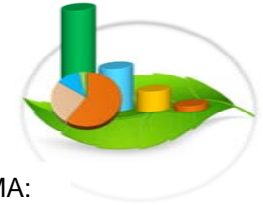
Gráfica 3-7.a. VOLUMEN DE MADERA MOVILIZADO EN LA REPÚBLICA DE PANAMÁ, POR PIEZAS Y FORMA: AÑOS 2014-2015