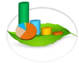
Gráfica 3-5.e. VOLUMEN DE MADERA OTORGADO PARA EL APROVECHAMIENTO FORESTAL EN LA REPÚBLICA DE PANAMÁ, POR ESPECIE MAYORMENTE APROVECHADA: AÑOS 2014-2015