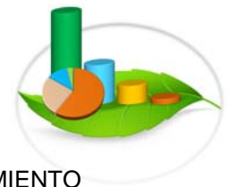
Gráfica 3-5.c. VOLUMEN DE MADERA OTORGADO PARA EL APROVECHAMIENTO FORESTAL EN LA REPÚBLICA DE PANAMÁ, POR TIPO DE PERMISO: AÑO 2015