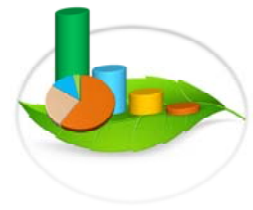
Gráfica 3-4.a. PERMISOS OTORGADOS MENSUALMENTE PARA EL APROVECHAMIENTO FORESTAL: AÑOS 2014-2015