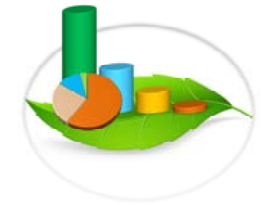
Gráfica. 3-3.3.a. CONCESIONES DE USO DEL AGUA OTORGADAS POR MIAMBIENTE, POR TIPO DE USO: AÑOS 2014-2015