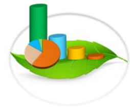
Cuadro 3-3.1. VOLUMEN ANUAL DE AGUA OTORGADO POR MIAMBIENTE EN LA REPÚBLICA DE PANAMÁ, POR TIPO DE USO: AÑOS 2014-2015