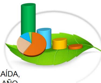
Cuadro 3-11. PRODUCTOS Y SUBPRODUCTOS DE FLORA EXTRAÍDA, POR PERMISO COMERCIAL, SEGÚN PROPÓSITO Y ESPECIE: AÑO 2014- 2015