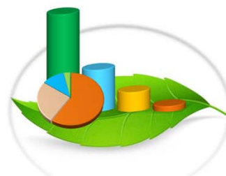
Cuadro 2-1. PERMISO DE DESCARGA DE AGUAS RESIDUALES, SEGÚN REGIONAL: AÑOS 2014- 2015