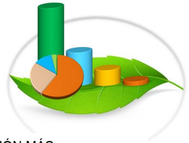
Cuadro 2-6. EMPRESAS IMPLEMENTANDO PRODUCCIÓN MÁS LIMPIA, POR REGIONAL: AÑOS 2000-2015