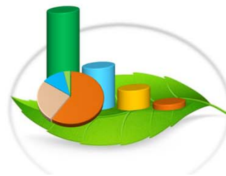
Cuadro 2-3.1. AUDITORÍAS AMBIENTALES Y PAMA'S INGRESADOS AL PROCESO DE EVALUACIÓN, SEGÚN REGIONAL: AÑOS 2014-2015