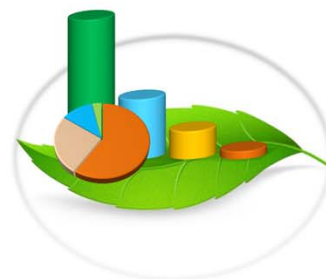
Cuadro 13-2. MAPAS ATENDIDOS EN LA DIRECCIÓN DE ADMINISTRACIÓN DE SISTEMAS DE INFORMACIÓN AMBIENTAL: AÑOS 2014-2015