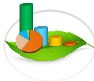
Gráfica 11-3.b. COMISIONES CONSULTIVAS DISTRITALES INSTALADAS, SEGÚN PROVINCIA Y COMARCAS: AÑOS 2014(junio) - 2015