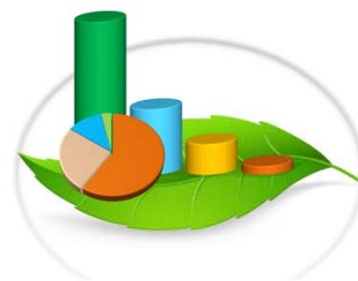
Cuadro 11-5. POBLACIÓN SENSIBILIZADA EN TEMAS AMBIENTALES, SEGÚN REGIONAL : AÑOS 2014-2015