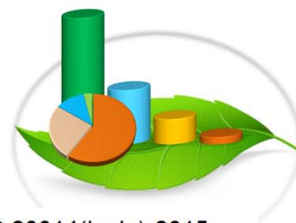
Gráfica 11-3.a. COMISIONES CONSULTIVAS AMBIENTALES INSTALADAS: AÑOS 2014(junio)-2015