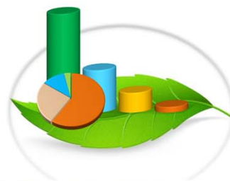
Cuadro 11-2. PERSONAS INSCRITAS EN EL PROGRAMA DE VOLUNTARIOS AMBIENTALES, POR SEXO, SEGÚN REGIONAL: AÑOS 2014- 2015