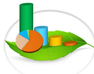
Cuadro 1-2. PRODUCCIÓN DE PLANTONES POR TIPO DE VIVERO, SEGÚN REGIONAL: AÑOS 2008- 2015