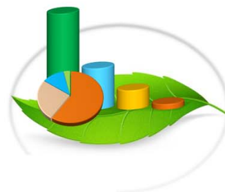
Cuadro 1-4. FAUNA SILVESTRE REPRODUCIDA EN ZOOCRIADEROS INSCRITOS, EN LA REPÚBLICA DE PANAMÁ, SEGÚN ESPECIE: AÑOS 2000 - 2015