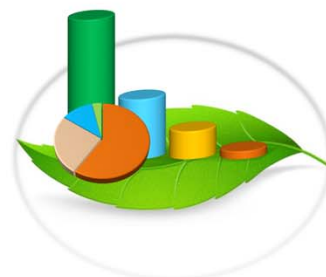
Cuadro 1-3. ZOCRIADEROS EXISTENTES INSCRITOS, EN LA REPÚBLICA DE PANAMÁ, SEGÚN REGIONAL: AÑOS 2000-2015